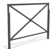
ST. ANDRÉ VVBA84